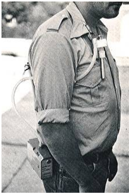
Fig. 5: Toma de muestra de polvo respirable

Colocar la bomba de aspiración, convenientemente calibrada, en la parte posterior de la cintura del operario a muestrear, asegurándola con un cinturón apropiado.