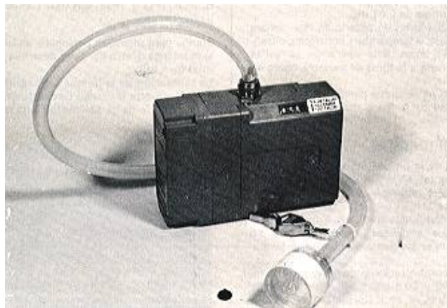
Fig. 3: Equipo de muestreo para polvo total

La cantidad de polvo captada sobre el filtro no debería exceder de los 4 ó 5 mg. en ningún caso, para evitar colmataciones en el filtro y desprendimientos de polvo.