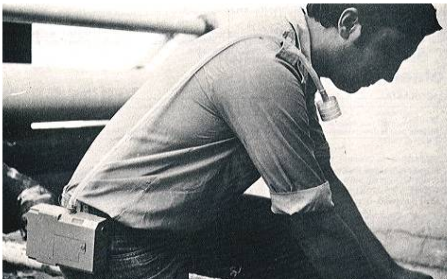
Fog. 4: Toma de muestra de polvo total